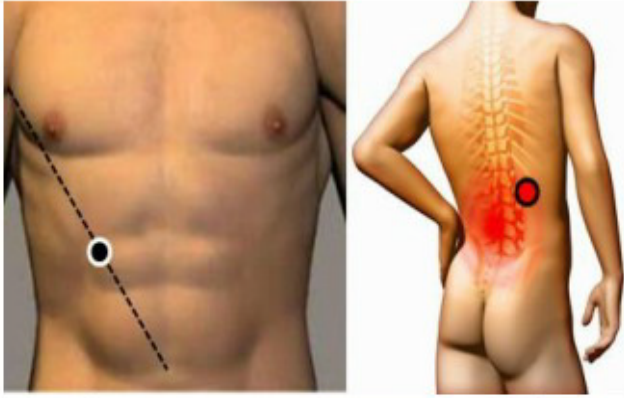
VESÍCULA - RIÑÓN Dch.