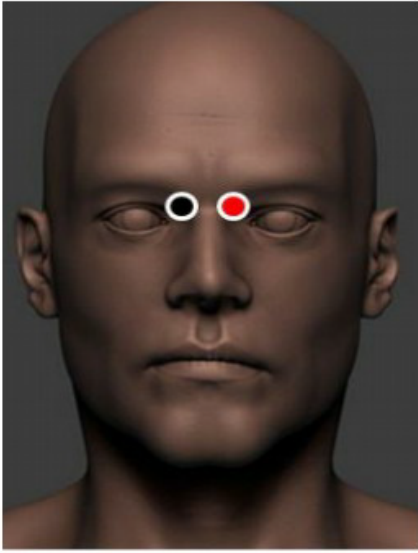
CRANEAL - CRANEAL

Sintomas en la nariz, pólipos, sangrado, supuración, dificultad para respirar, laringitis, otitis, mala visión, fotofobia, conjutivitis.