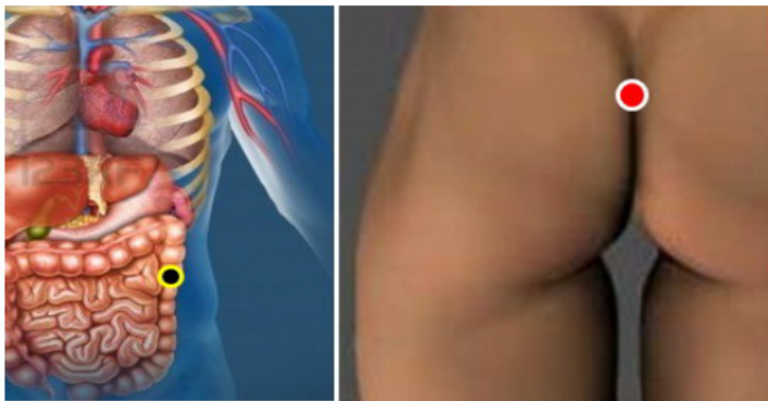
COLON DESCENDENTE - RECTO

Sintomas en la nariz, pólipos, sangrado, supuración, dificultad para respirar, laringitis, otitis, mala visión, fotofobia, conjutivitis.