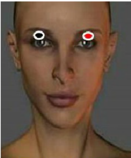
PÁRPADO - PÁRPADO

Congestión nasal, sangrado de nariz, gripe, laringitis, faringitis, conjutivitis y lesiones oculares.